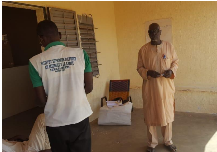
Inrichting van de apotheek