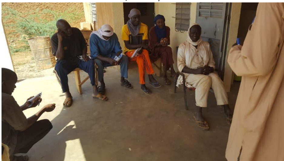
leden van het Comité