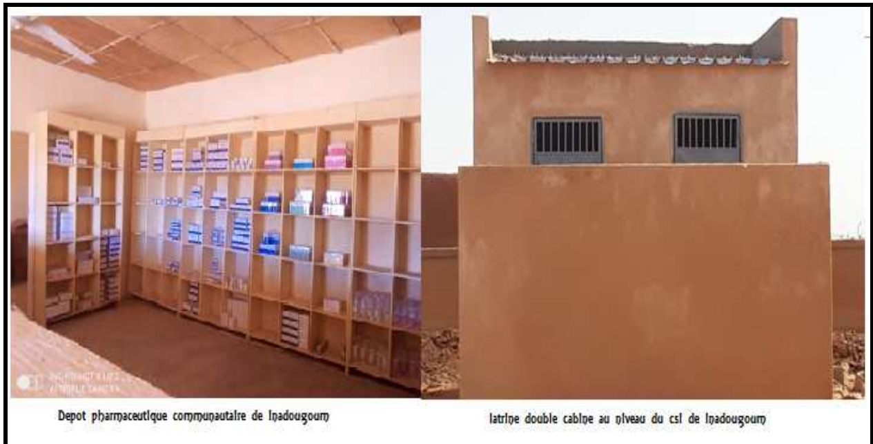
Depot pharmaceutique communautaire de Inadougoum