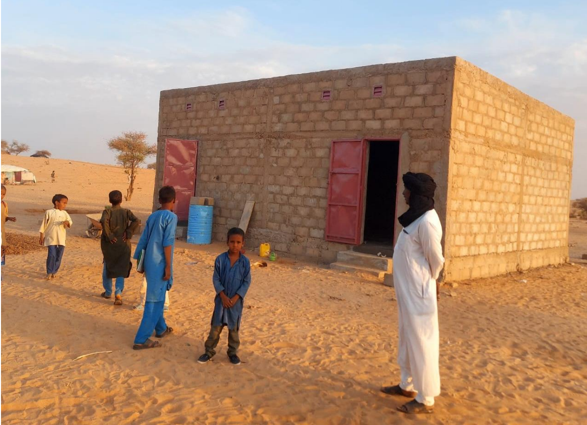
Foto: kinderen en leerkracht voor een van de nieuwe klaslokalen.

Om dit project te kunnen uitvoeren, hebben wij als vrijwilligersorganisatie financiële ondersteuning nodig. Wij hopen daarom dat u onze werkwijze en het belang van dit project onderschrijft en vragen u om een bijdrage.