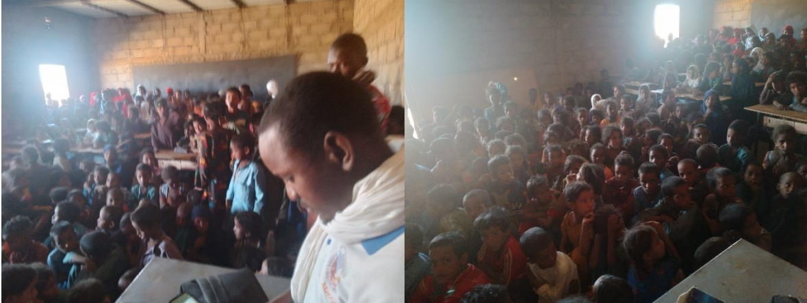
Foto: les i een overvol klaslokaal De meeste kinderen zitten op de grond

In 2024 willen we de school ondersteunen bij het inrichten van de lokalen. Men wil graag beschikken over 50 tafelbanken, voor 150 kinderen.